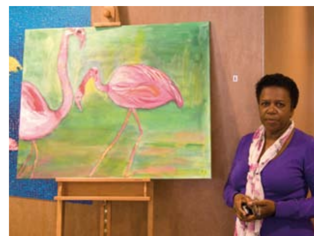
... ‘exposeren voor collega’s en patiënten is dubbel eng’...