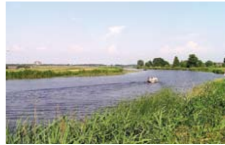
De Holendrecht is een rit of wandeling meer dan waard.

In de jaren '60 werd de rust ruw verstoord door het gebulder van vrachtwagen en heimachines. De nieuwe woonwijk Bijlmer