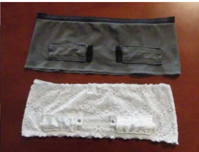
“Mijn banden hebben niks met ziekte te maken. Ze zien er totaal niet medisch uit.”