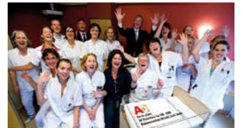
Het blijde nieuws werd in het Diakonessenhuis met gejuich ontvangen. Dianet feliciteerde haar samenwerkingspartner met een bloemetje.

Het AD stelt de geroemde en gevreesde ranglijst elk jaar samen, op basis van onder andere objectieve kwaliteitsaspecten en patiënttevredenheid. Vijf jaar geleden kwam het Diakonessenhuis ook al als beste uit de bus. Het Academisch Medisch Centrum (AMC) in Amsterdam werd dit jaar twaalfde, direct gevolgd door het Universitair Medisch Centrum Utrecht. In Amsterdam concentreren onze activiteiten zich in het AMC, waar een complete zorgstraat is gecreëerd. Op medisch terrein werkt Dianet nauw samen met het Universitair Medisch Centrum Utrecht (UMCU).